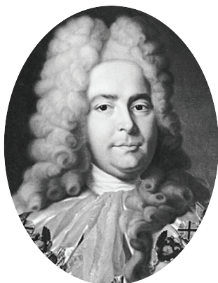
Генерал-прокурор Павел Иванович Ягужинский