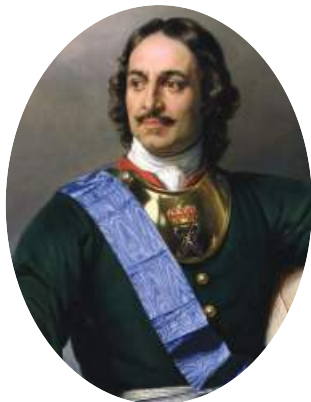
Император Петр I

Сообщениями «о похищении казны» первоначально занималась тайная канцелярия во главе с графом П.А. Толстым. И работала она на совесть. Но были и такие дворяне и чиновники, которые к проблеме мздоимства относились гораздо терпимее. По рассказам современников, однажды в Сенате Петр пригрозил издать указ, по которому всякий, кто украдет у казны сумму, на которую можно купить веревку, будет повешен. Генерал-прокурор Ягужинский на это заметил: «Неужели вы хотите остаться императором без служителей и подданных? Мы все воруют — с тем только различием, что один больше и приметнее, чем другой».