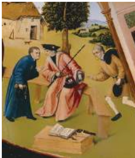
Фрагмент «Алчность» картины Иеронима Босха «Семь смертных грехов»

Рассматривая участников коррупции на примере взяточничества, стоит отметить, что в коррупционном процессе всегда участвуют две стороны. Одна сторона — это взяткополучатель (подкупаемый). Вторая сторона — это взяткодатель (осуществляющий подкуп). Также в процессе может участвовать и третья сторона — посредник.