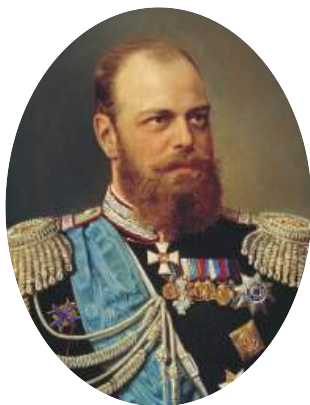
Император Александр III