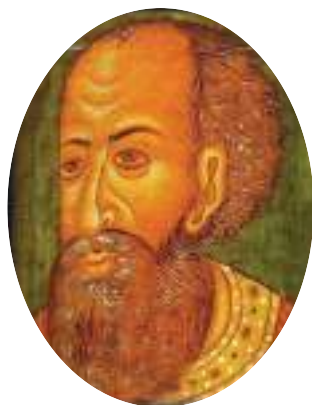
Царь Иван IV Грозный