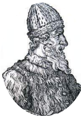
Великий князь Иван III

До XVIII века чиновники на Руси жили благодаря так называемым «кормлениям», то есть, при отсутствии оклада за исправление должности, разрешению на подношения от заинтересованных в их деятельности лиц. Одаривали их не только деньгами, но и «натурой» — мясом, рыбой, пирогами и пр., что было делом обыкновенным.